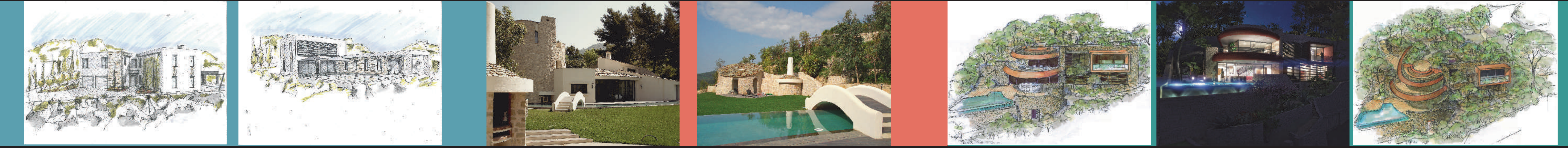
Grégory Mazzaresé /// Villa Schenck /// Roquette sur Var /// PC en cours