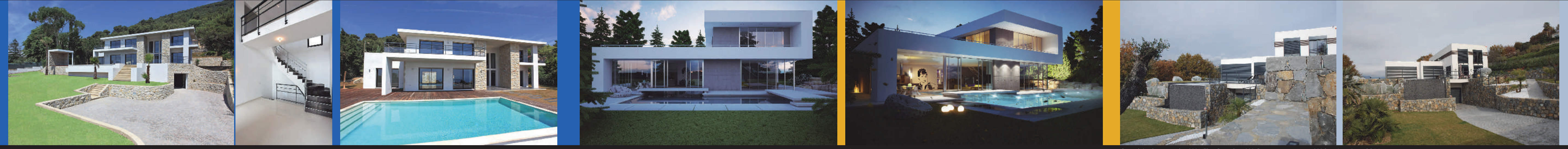
Osvaldo Spagnolo /// Villa Fahe /// Villefranche sur Mer /// 2007