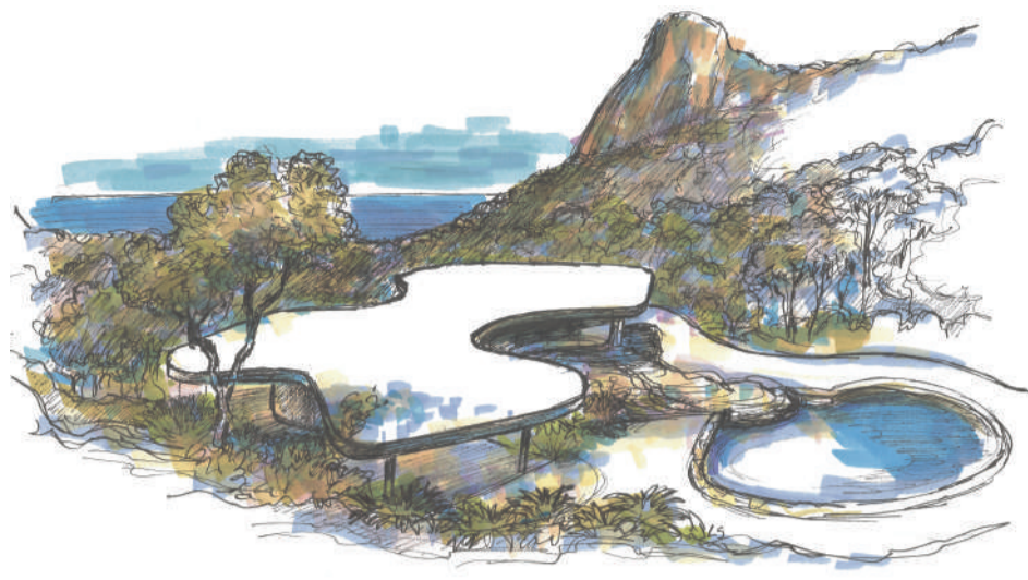
OSCAR NIEMEYER /// VILLA CANOAS /// ENVIRON DE RIO (BARRA DE TIJUCA) /// 1951