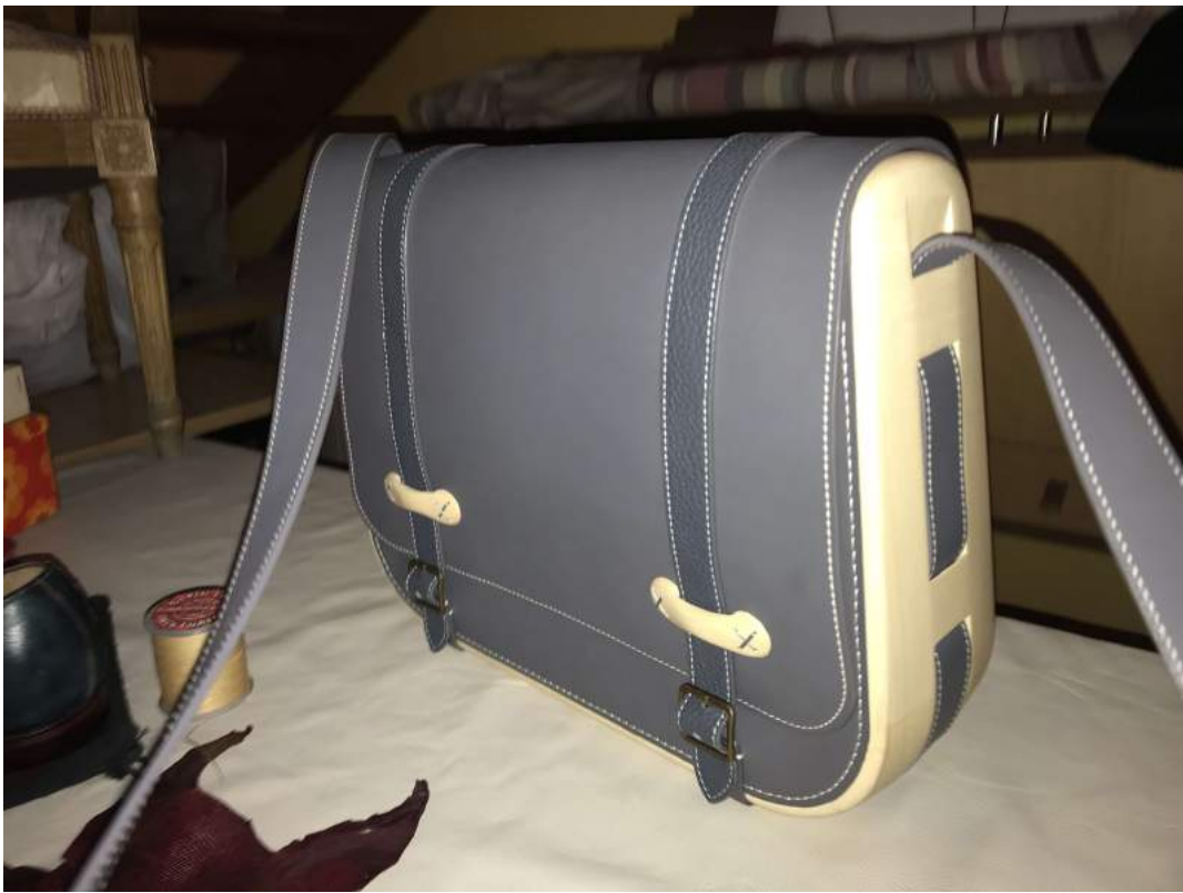
Sac bois et cuir végétal