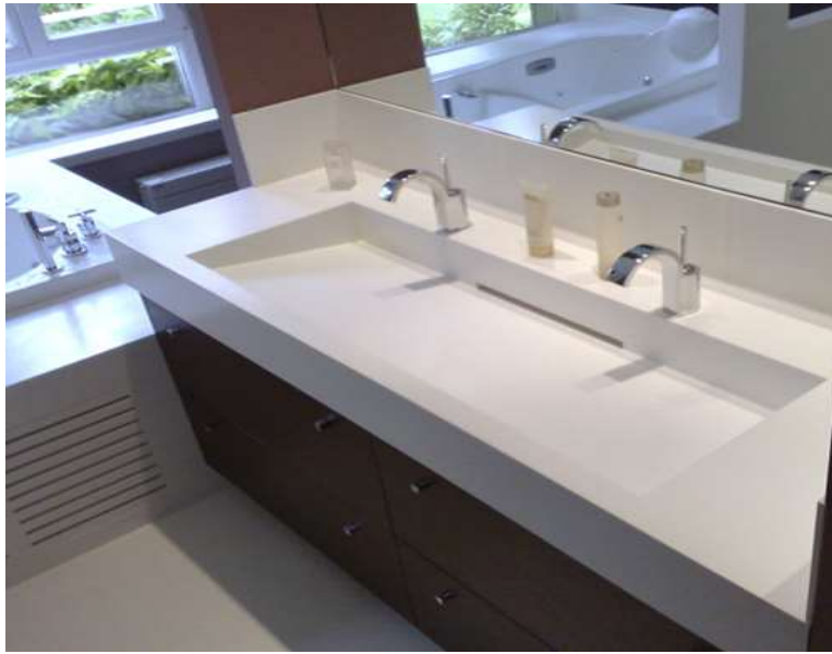
Meuble de salle de bain