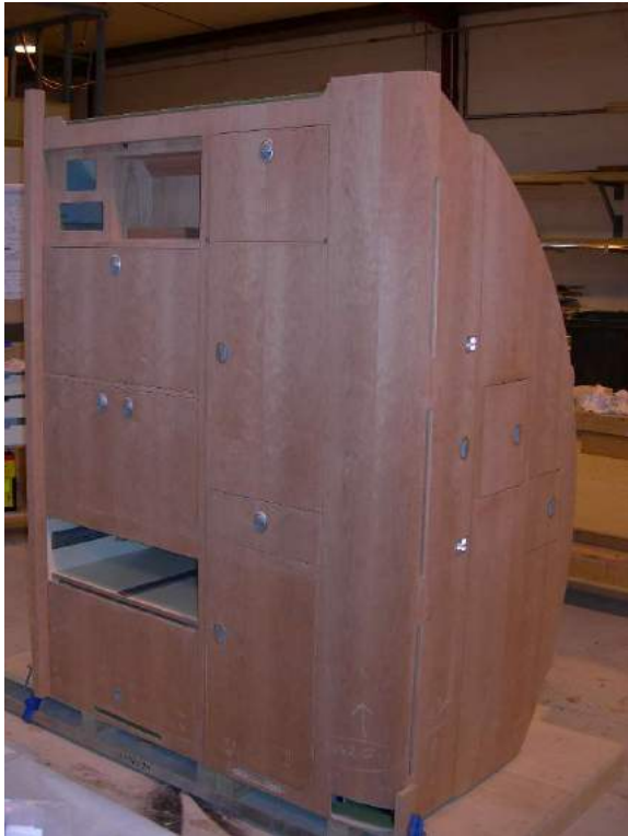
Meuble Jet Privé