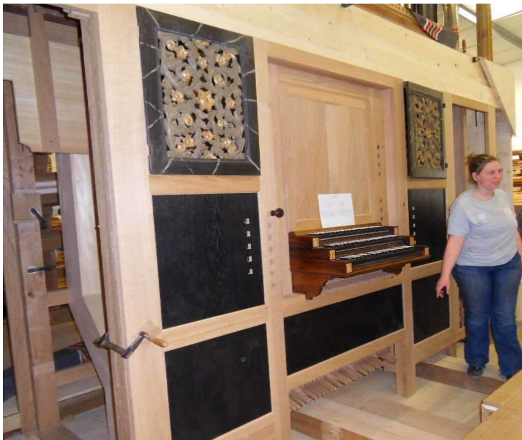
Face avant de l'orgue